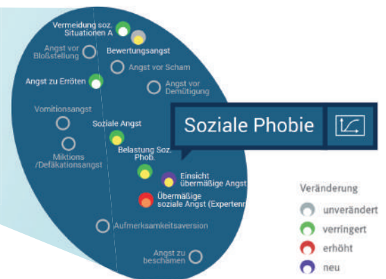
Klenico-Veränderungskarte im Detail-Modus

Das Klenico-System stellt sicher, dass Komorbiditäten, aber auch einzelne Symptome mit grossem Belastungswert für den Patienten nicht aus dem Blickfeld geraten.